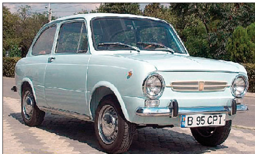
Pe TĂRICEANU l-ar fi costat o avere înmatricularea mașinii sale de colecție