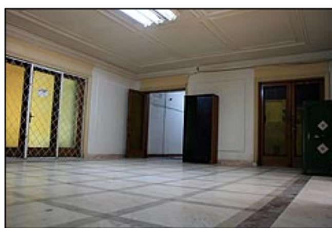
Holul Editurii Politice in 1990