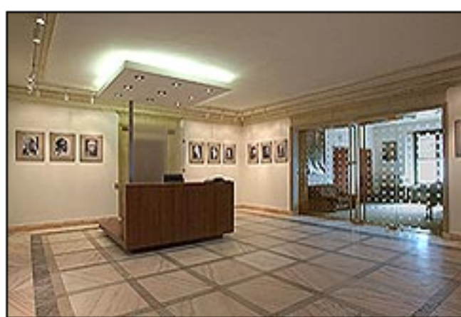
Holul Editurii Humanitas in 2005

Iar acum ajungem la povestea cu esalonarile solicitate de Humanitas in 2000 Ministerului Finantelor.