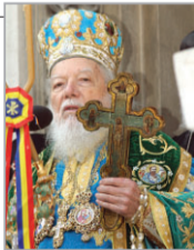
Preafericitul Patriarh Teoctist

„Să ne curățim simțirile și să vedem pe Hristos strălucind cu neapropiată lumină a Învierii!” (Din Cântările Învierii)